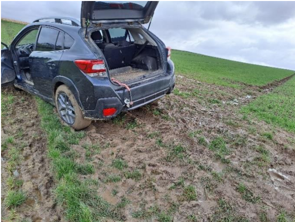
Abb. 3: Furche als Entwässerungsgraben. Hier bahnt sich das Wasser durch die Endfurche seinen Weg. Das Wasser läuft über den Feldweg - macht diesen unpassierbar – und entwässert schließlich in die Nachbarfläche.