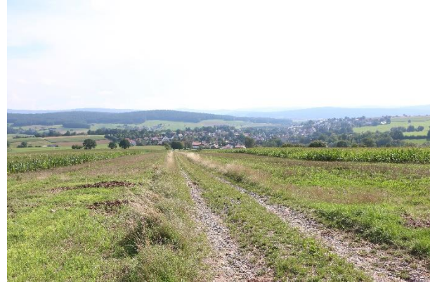
Abb. 7: Um Erosion dauerhaft zu verhindern, wurde das ehemalige Vorgewende mit Feldgras eingesät und stillgelegt.