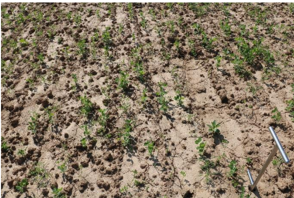
Abb. 4: Stark verschlämmter Boden nach Felderbsen. Hier wurde nach der Ernte so tief gearbeitet, dass keine Mulchauflage auf der Fläche verblieb.

Besonders gefährdet für Erosion sind Lössböden mit einem hohem Schluffanteil. Durch die Aufprallenergie der Regentropfen verschlämmt die Oberfläche und das Wasser kann schlecht einsickern (s. Abb. 4 und 5 unten). Abhilfe schafft hier eine Mulchauflage (s. Abb. 5). Die Energie der Regentropfen wird durch das organische Material abgebremst. Die Mulchauflage dient zudem verschiedensten Bodenlebewesen als Nahrung. Der Boden wird mit einem Netz von Regenwurmgängern durchzogen, wodurch Wasser besser in den Unterboden infiltriert.