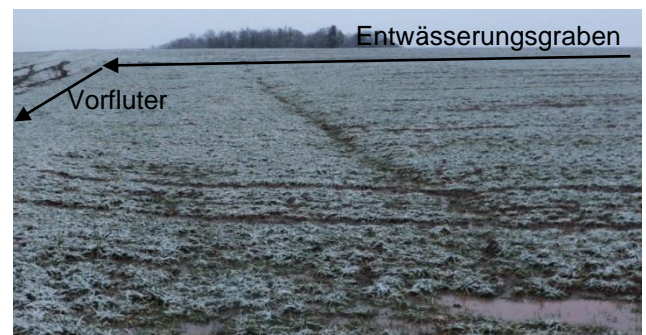
Abb. 2: Fläche aus Abb.1 von unten. Das Wasser bricht aus dem gezogenen Graben aus und sammelt sich in Mulden am unteren Teil der Fläche.