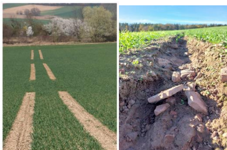
Abb. 10: Rechts: Freigeschwemmte Fahrgasse vor der Begrünung. Links: Beispiel für partielle Fahrgassenbegrünung