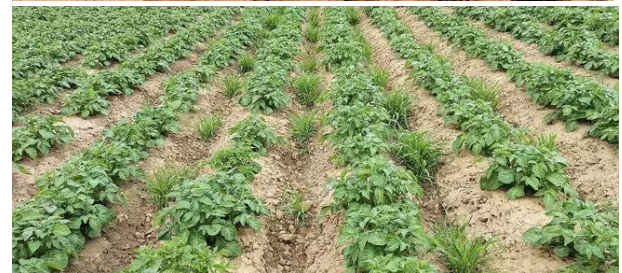
Abb. 11: Dammformer mit Querdammhäufner und aufgebauter Sähmaschine (oben). Das Ergebnis der Begrünten Querdämme zeigt das untere Bild.

Bei Fragen stehen wir Ihnen gerne zur Verfügung.