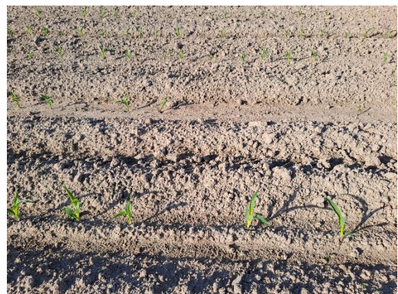
Abb. 5: Die Mulchauflage macht den Unterschied: Nach einem Starkregenereignis am 25.05.2023 war in Pflugsaat bestellter Mais in den Säreihen verschlämmt (unten). Der in Mulchsaat bestellte Mais der Nachbarfläche zeigte hingegen keine Schäden (oben).