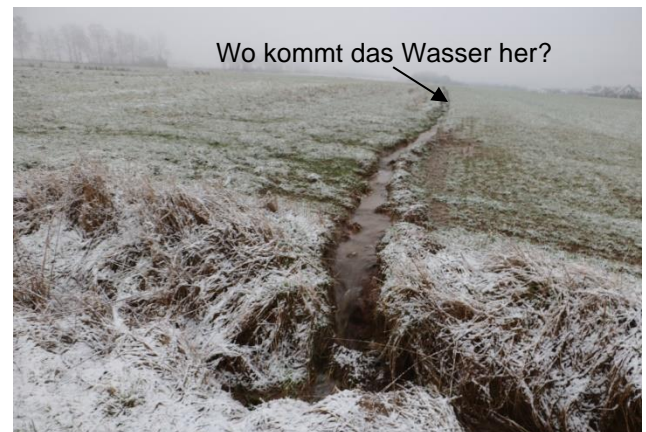
Abb. 1: Entwässerungsgräben quer über die Fläche. Eine sinnvolle Maßnahme?

hinunter, wo es sich am Hangfuß schließlich in Mulden sammelt (Abb. 2). Derselbe Mechanismus zeigt sich auch in Abb.3. Hier bahnt sich das Wasser durch die Endfurche zwischen zwei benachbarten Flächen seinen Weg den Hang hinunter, überspült den Feldweg und läuft schließlich in die benachbarte Fläche hinein. Ohne die Endfurche würde das Wasser einfach auf der Fläche versickern. Das Hauptziel sollte somit immer sein, dass Wasser breit auf der Fläche versickern zu lassen, auf der es auch niedergereget ist. Hier bietet sich statt der Grabenfurche die Anlage eines dauerhaften Begrünungstreifens an.