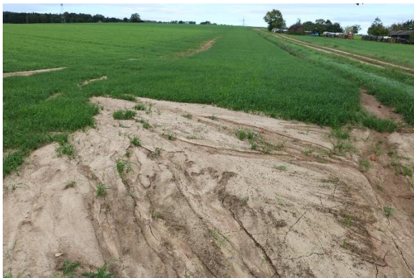
Abb. 6: Spuren von heftiger Erosion in Landsberger Gemenge

Die gravierendsten Erosionsereignisse kommen in der Regel bei Hackfrüchten vor. Jedoch gibt es Flächen, welche unabhängig der angebauten Kultur vor allem im Vorgewende Probleme mit Erosion haben. In Abb. 7 ist ein derartiger Flächenkomplex abgebildet. Im ehemaligen Vorgewende links und rechts des Weges traten im Grunde bei jedem Niederschlag Erosionsereignisse auf. Die Vorgewende wurden hier als Schutzmaßnahme aus der Produktion genommen und werden nun zum Wenden der Maschinen genutzt. Die Bearbeitungsrichtung verläuft somit über die gesamten Flächen quer zum Hang. Denkbar ist für diesen Zweck auch die Anwendung des HALM Programmes C.3.3, wenn die Vorgewendebegrünung mind. 6 Meter breit sein kann.