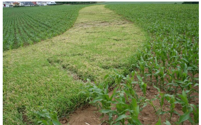
Erosionsschutzstreifen im Mais mit Wintergerste