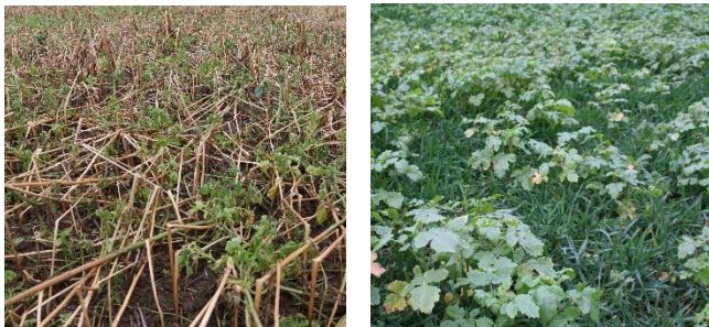
Weitgehend abgefrorene Zwischenfrucht (links) und vitale Zwischenfrucht mit Ausfallgetreide (rechts)

Kurz vor der Maisbestellung finden wir dieses Jahr auf Flächen, auf denen die Zwischenfrüchte noch nicht eingearbeitet sind, meist folgende zwei Bilder: