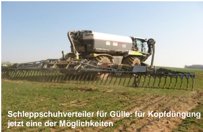
Schleppschuhverteiler für Gülle: für Kopfdüngung jetzt eine der Möglichkeiten