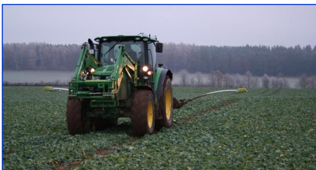
Scannen eines Rapsbestandes im Herbst (Claas Crop Sensor)

Möglich ist ein Anbau an die Heck-/Fronthydraulik (z. B. Claas Crop Sensor) oder ein Aufbau auf das Schlepperdach (z. B. Yara N-Sensor). Beim Scannen bewegt sich der Schlepper in den Fahrspuren, was eine zügige und schadensfreie Messung der Biomasse erlaubt.