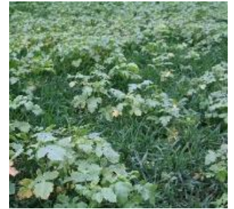
Weitgehend abgefrorene Zwischenfrucht (links) und vitale Zwischenfrucht mit Ausfallgetreide (rechts)

Optimal sind in einem ersten Schritt schneidende Werkzeuge, die das Ausfallgetreide bzw. die Zwischenfrucht sauber vom Wurzelpaket trennen.