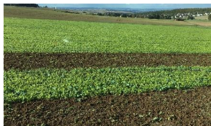
Ramtill-Aussaat mit Grünlandstriegel in Erbsenstoppel (oben), Einarbeitung Mitte Oktober mit Grubber (unten) vor der Weizenbestellung

lassen und dann beseitigen. Wenn der Raps nur alle sechs Jahre in der Fruchtfolge steht, wie es aus phytosanitären Gründen nötig ist, bereitet der Ausfallraps keine Probleme.