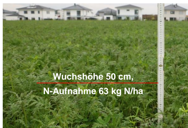
Abb. 2: Phacelia, Ramtill und AlexKlee (PGM5). Wie dieser Bestand zeigt, ist die Faustzahl sehr konservativ. Viele Bestände nehmen deutlich mehr Stickstoff auf.