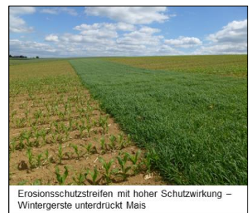
Erosionsschutzstreifen mit hoher Schutzwirkung – Wintergerste unterdrückt Mais

Kräftig bestockter Streifen mit dichter Bodenbedeckung, der die Hauptfrucht unterdrückt.